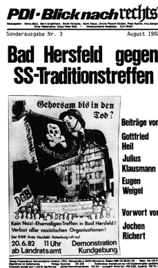
Abbildung 4: Cover eines Sonderheftes des »blick nach rechts« von 1982.

Seit 1979 wurde zusätzlich ein neues Reihenformat, das »PDI-Taschenbuch«, etabliert. In Ausgabe Nr. 2 befasste man sich mit den »Rechtstendenzen in der Bundesrepublik« (1979) und versammelte Beiträge unter anderem von etlichen SPD-Bundestagsabgeordneten. 81 Im Jahr darauf brachte der PDI den vierzehntäglich erscheinenden bnr heraus, der wiederum eigene Sonderausgaben hatte (Abbildung 4). 82