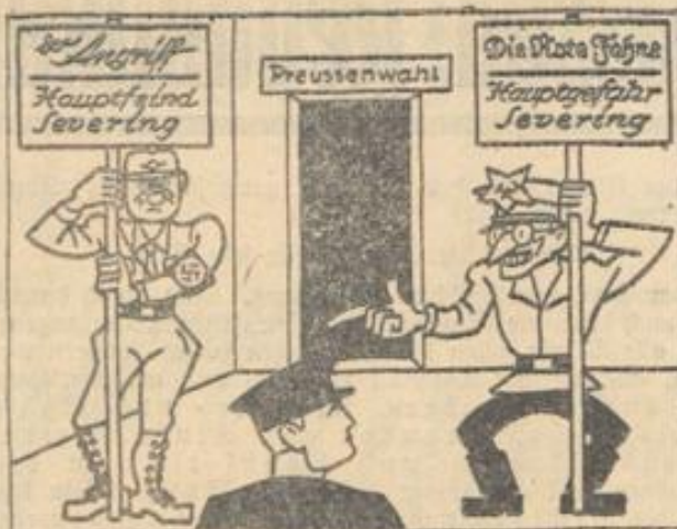
„Die Hauptgefahr ist Severing, er löst die SA nicht auf.“

Verbot nationalsozialistischer Zeitungen. Der badische Minister des Innern hat die Verzeigerung „Der Führer“ auf die Dauer von 8 Tagen verboten. Auf die Dauer von 10 Tagen wurde das in Formmengen erscheinende nationalsozialistische „Schwarzwälder Tagblatt“ verboten, weil in einem Artikel grobe Beschimpfungen des Herrn Reichspräsidenten enthalten waren.