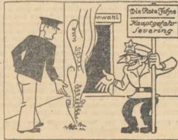
„Nun, ist Severing noch immer die Hauptgefahr?“ „Natürlich, die SA ist doch nur Hitler zu Gefallen aufgelöst worden!“