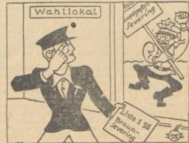
„Idioten ist nicht zu helfen. Ich wähle Braun-Severing!“