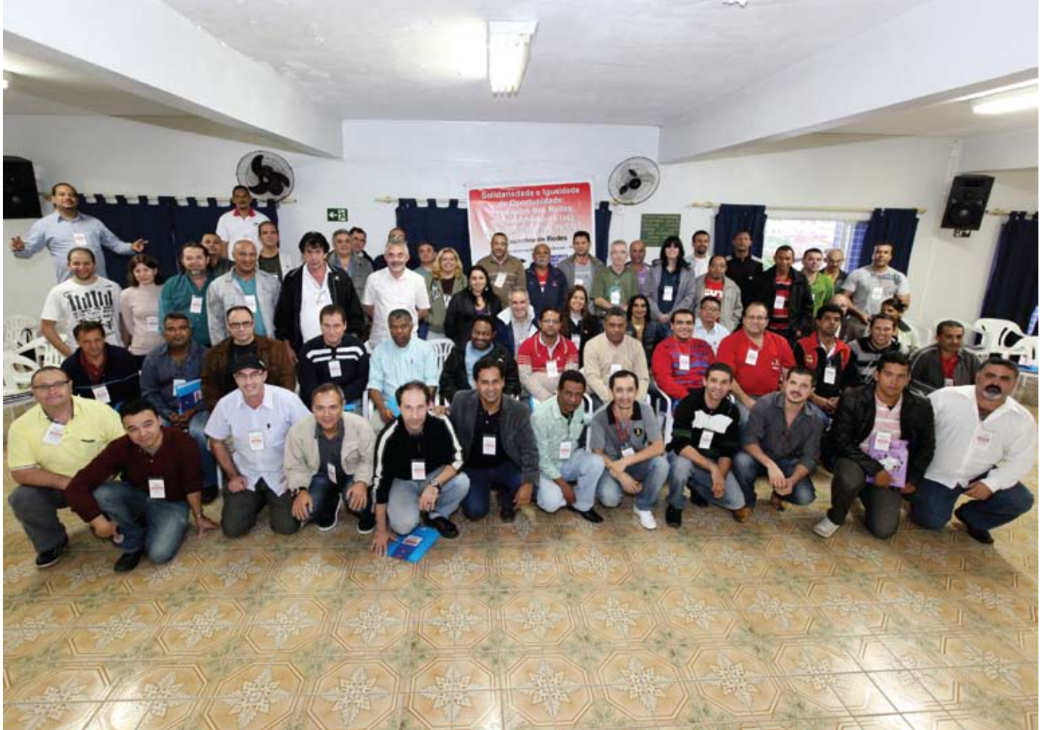
Participantes do II Encontro de Redes da CNQ-CUT – dias 15 e 16 de junho de 2011 – Praia Grande – São Paulo