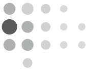
Grafik 1 Das australische Zuwanderungssystem ohne Zuzug aus Neuseeland (in Klammern Zahl der Zuwanderer im Programm 2011/12)