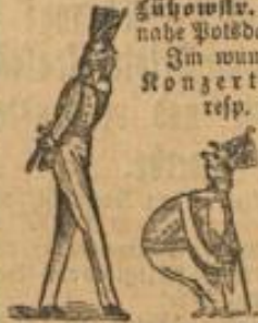
Vorverkauf-Billets (für die Wochentage) 40 Pf. und Familien-Billets 4 1 M. (für 3 Personen giltig). (Siehe Plakate).

(Meysel, Pietro, Britten, Steidl, Krone, Böhl und Schrader). Täglich außer Sonnabends Victoria-Brauerei Zühovstr. 111-112, nahe Potsdamer Brücke. Im wundervollen Konzert-Garten resp. Saal. Anfang 8 Uhr. Sonntag 7 Uhr. Entree 50 Pf. Vorverkauf-Billets (für die Wochentage) 40 Pf. und Familien-Billets 4 1 M. (für 3 Personen giltig). (Siehe Plakate). Großartiges Programm! Jeden Donnerstag und Sonntag nach der Soiree: Tanzkränzchen.