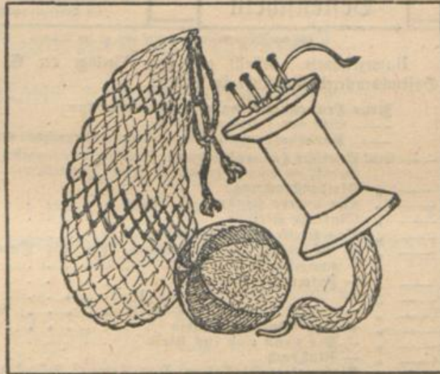
25. Ballnetz, Ball und Pferdeleine.

Aus dem 4. Heft dieser Beschäftigungsbücher, Kleine Geschenke von Kinderhand von Emma Gumbert, ist das geknüpft Ballnetz Abb. 25 entnommen, zu dem man hartes Wollgarn nimmt. Je nach der gewünschten Größe wird mit 10 oder 12 Fadenschlingen angefangen. Man nimmt dazu Fäden von 120 cm Länge, die man in der Mitte zusammenlegt und in gleichem Abstände voneinander auf der Sofalehne feststeckt. Zunächst werden die Fäden unter den Schlingen verknüpft, in der zweiten Knotenreihe werden die Fäden getrennt und mit den danebenliegenden verknüpft, in der dritten wieder vereint. Zuerst knotet man nur die mittleren Fäden, die rechts und links liegenden läßt man vorläufig hängen, bis der Beutel die