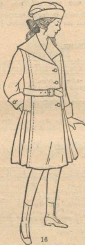
16. Mantel für größere Mädchen.

Der Fettmangel ist wohl die Hauptursache der jetzt herrschenden Unterernährung. Jedenfalls müssen wir baldigt zu einer Befundung der Ernährungsverhältnisse in Deutschland kommen. Vieles, beinahe alles ist davon abhängig.