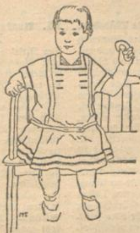
13. Mittelkleid für kleine Kinder.

Was vom Volkslied gilt, das gilt auch vom Kinderlied: auch für dieses ist kennzeichnend das Unbekanntsein des Verfassers; ohne Pflege sproßt es wie Feld- und Waldblumen hervor, ein gemeinsames Erbe der ganzen, deutschen Kinderwelt. Was die Mutter den Kindern singt zur Unterhaltung, das wird von ihnen aufgenommen und umgeformt, sie schaffen in der Freude am Klange, aus der übersprudelnden Fülle ihrer kindlichen Phantasie. Seine Stoffe wählt das Kind aus der umgebenden Natur, die Tiere sind seine Freunde, es singt vom Wind und vom Wetter, vom Baum im Walde und dem Grassalm auf dem Feld. Es hat oft Freude am Klingklang der Silbenspieleret, es formt auch Spott- und Flügengedichte. Und mehr noch wie beim Lied der Erwachsenen findet sich beim Kinde zu Wort und Lied auch Spiel und Tanz; das Kind will im Spiel darstellen, was es erlebt und fröhliche Bewegung ist ihm Lebensbedürfnis.