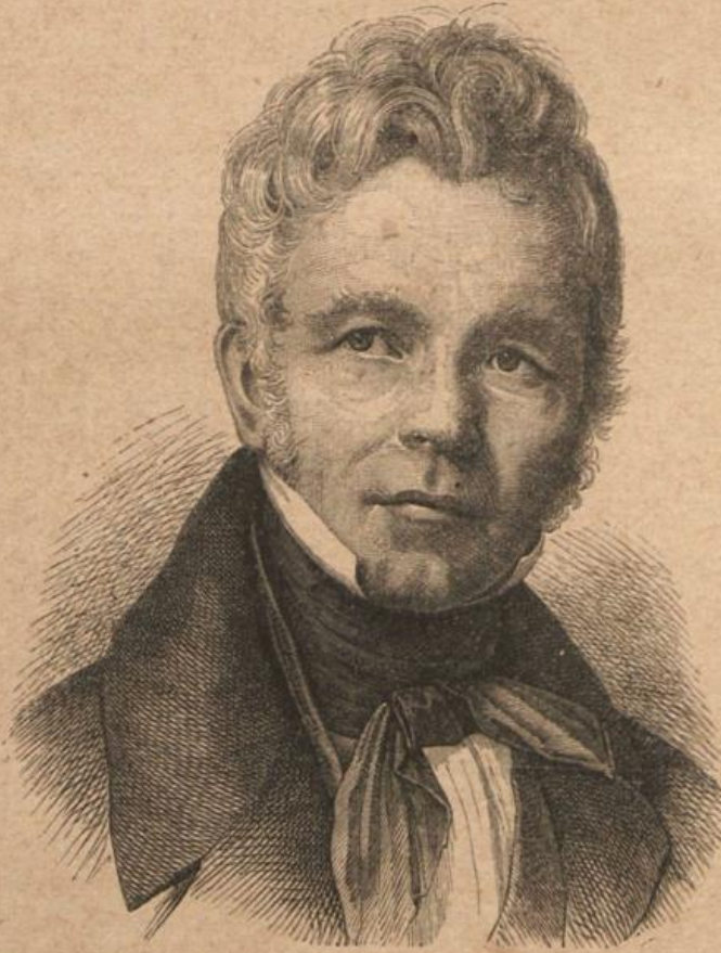
Karl Friedrich Schinkel.