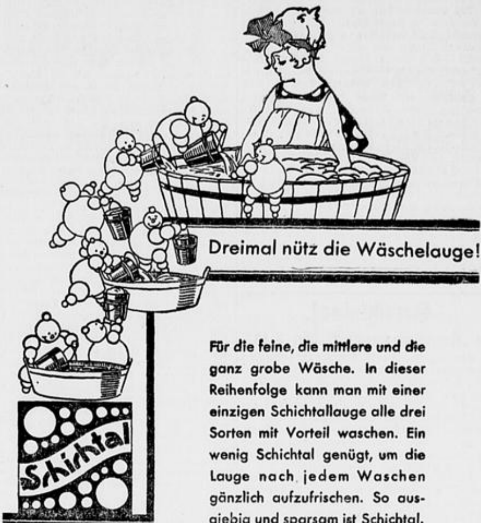
Dreimal nützlich die Wäschelauge!