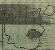
Einmarsch ins Sudetenland