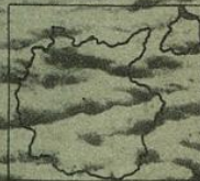
Memelgebiet geht wieder zurück