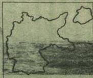
Saarbefreiung u. Rheinlandbesetzung