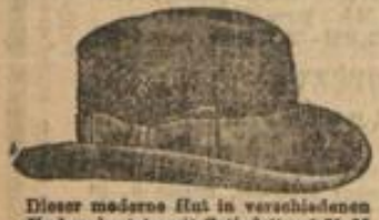
Dieser moderne Hut in verschiedenen Farben kostet mit Kalbfutter 1,75 M. mit Allausfutter 2 M.

1. Vortrag des Genossen Ströbig über: Der Streik der Glasfenstmacher, dessen Ende und Bedeutung für die Arbeiterbewegung. 2. Diskussion. 3. Verschiedenes. Zahlreiches Erscheinen erwartet Der Einsender.