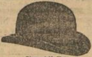
Dieser steife Hut kostet mit Futter 2 M.