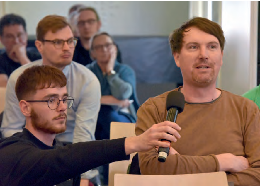
Frage aus dem Publikum

gearbeitet, und das ist gerade ein Thema, das mich beschäftigt. Die Geschichts- didaktik hatte das bis vor etwa zwei Jahren kaum im Blick: dass plötzlich neue Player auf diesem Markt der Erinnerung auftreten. Medienwandel gab es natür- lich schon früher – vom Guido-Knopp-Fernsehformat über Augmented Reality bis zu YouTube-Formaten wie MrWissen2go . Man rennt diesen neuen Formaten oft hinterher. Ich habe mir vorgenommen, mich erst wieder stärker mit Ge- schichtskultur zu beschäftigen, wenn es eine echte Zäsur gibt.