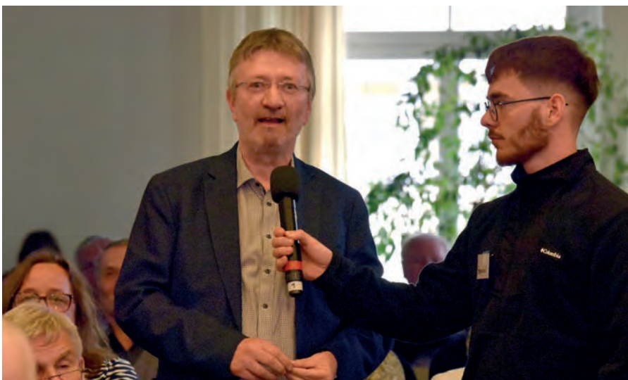
Frage aus dem Publikum

Wende kritisiert wurde, sondern um Handlungsspielräume zu sichern und zu erweitern. Um eine Verbesserung des kirchlichen Handelns zu erreichen. Die evangelischen Kirchen sind den Weg des Dialogs gegangen, des Miteinanders, aber sie haben in diesem Prozess sehr viel verloren.