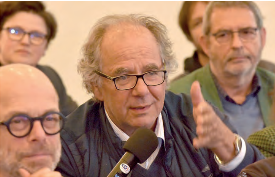
Frage aus dem Publikum

Ein wesentlicher Kostenfaktor war die Technik: Abspielgeräte, Geräte zum Vervielfältigen, gute Boxen und Schallplatten. Dazu habe nun auch ich eine Anekdote: Ein Jazz-Fan aus Nordhausen – Informatikstudent und großer Zappa-Fan, bis heute – fuhr am Wochenende mal wieder auf ein Konzert. Im Zug bot ihm ein fahrender Händler, den er kannte, denn man kannte einander in der Szene, eine ganz seltene Zappa-Doppelplatte an. 800 Mark. Das war mehr als sein Monatsverdienst. Hat er sich natürlich gekauft. Das Wochenende war finanziell gelaufen – aber er hatte die Platte in der Tasche.