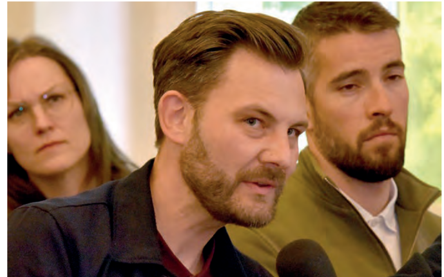
Frage aus dem Publikum

Ein Kumpel von mir, der so einen stehenden grünen Iro hatte, hat Ostgeld in Westgeld getauscht, vom Westgeld im Intershop Kaugummistangen gekauft, hat die mit Gewinn verkauft, wieder getauscht, ging wieder in den Intershop ... der