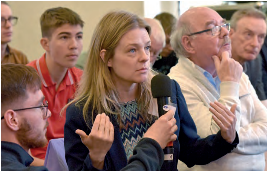
Frage aus dem Publikum

ethnisch aufgeladen und diente als Rechtfertigung für verstärkte Kontrolle, Segregation und Exklusion. Hier gäbe es noch viel Forschungsbedarf.