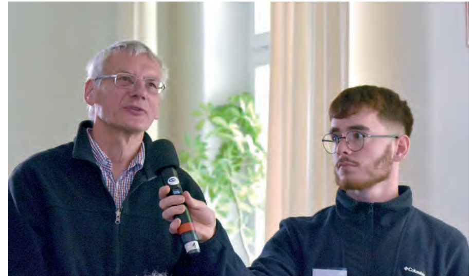
Frage aus dem Publikum