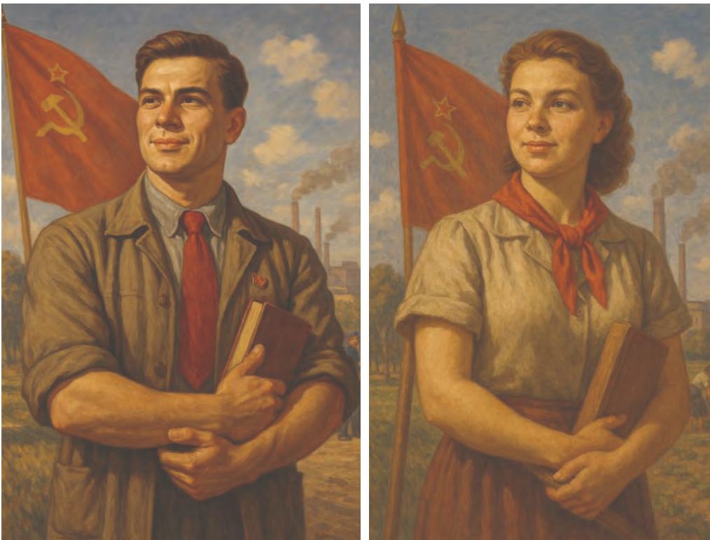
Abb. 1 und 2, KI-generierte Bilder idealtypischer sozialistischer Menschen.

bild umgestaltet werden sollte. Damit eröffnete sich ein Spannungsfeld: Mit der Sowjetunion sollte nun ein Land als Vorbild dienen, dessen Einwohner unmittelbar zuvor, während der NS-Zeit, noch als „Untermenschen“ gegolten hatten. 2