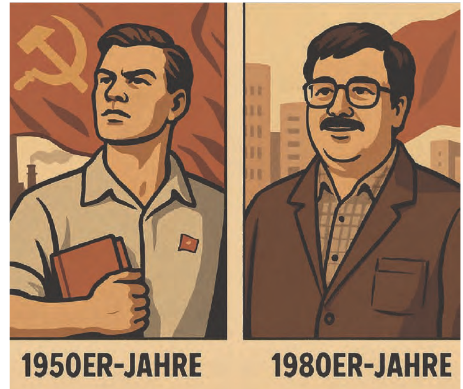
Abb. 3, KI-generiert, sozialistischer Idealtypus der 1950/80er Jahre.

Wie sollte der sozialistische Mensch sein?