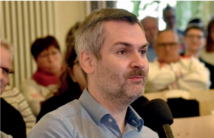
Frage aus dem Publikum

liche Prostituierte ebenso wie andere Männer, die an Treffpunkten, auf „Klappen“ oder in Parks, verkehrt haben. Diese wurden listenmäßig erfasst. In den frühen 1990er Jahren war es ein großes Anliegen homosexueller Vertreter, diese sogenannten rosa Listen löschen zu lassen.