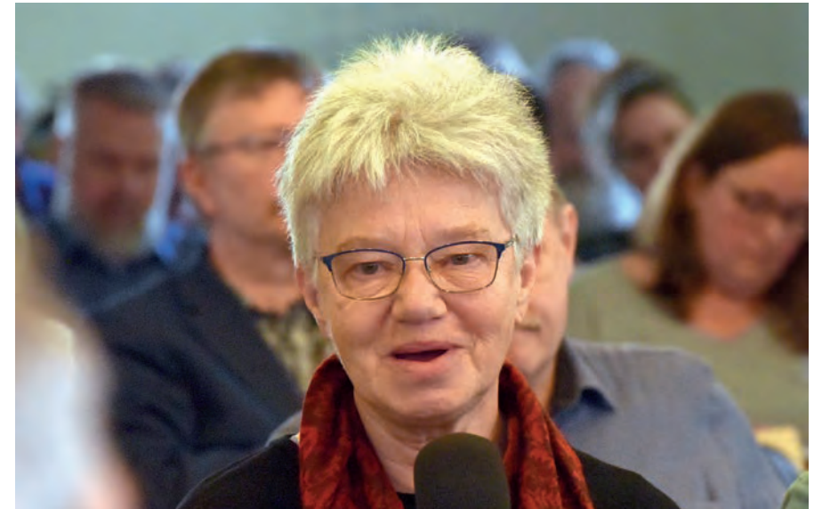
Frage aus dem Publikum