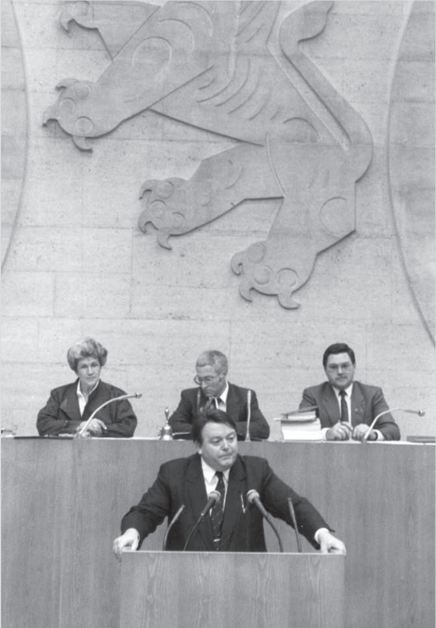
Der Ministerpräsident Holger Börner spricht im Landtag, 1978