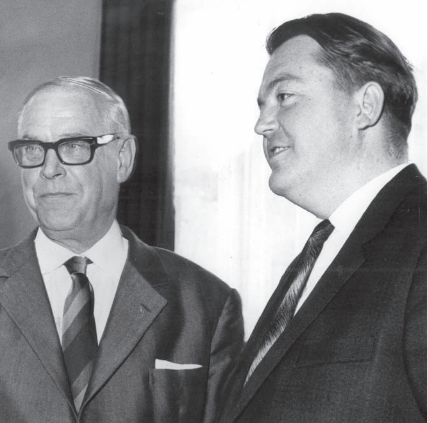
Holger Börner als Vorsitzender der Stadtverordnetenfraktion Kassel im Gespräch mit dem hessischen Ministerpräsidenten Georg August Zinn, 10.10.1964