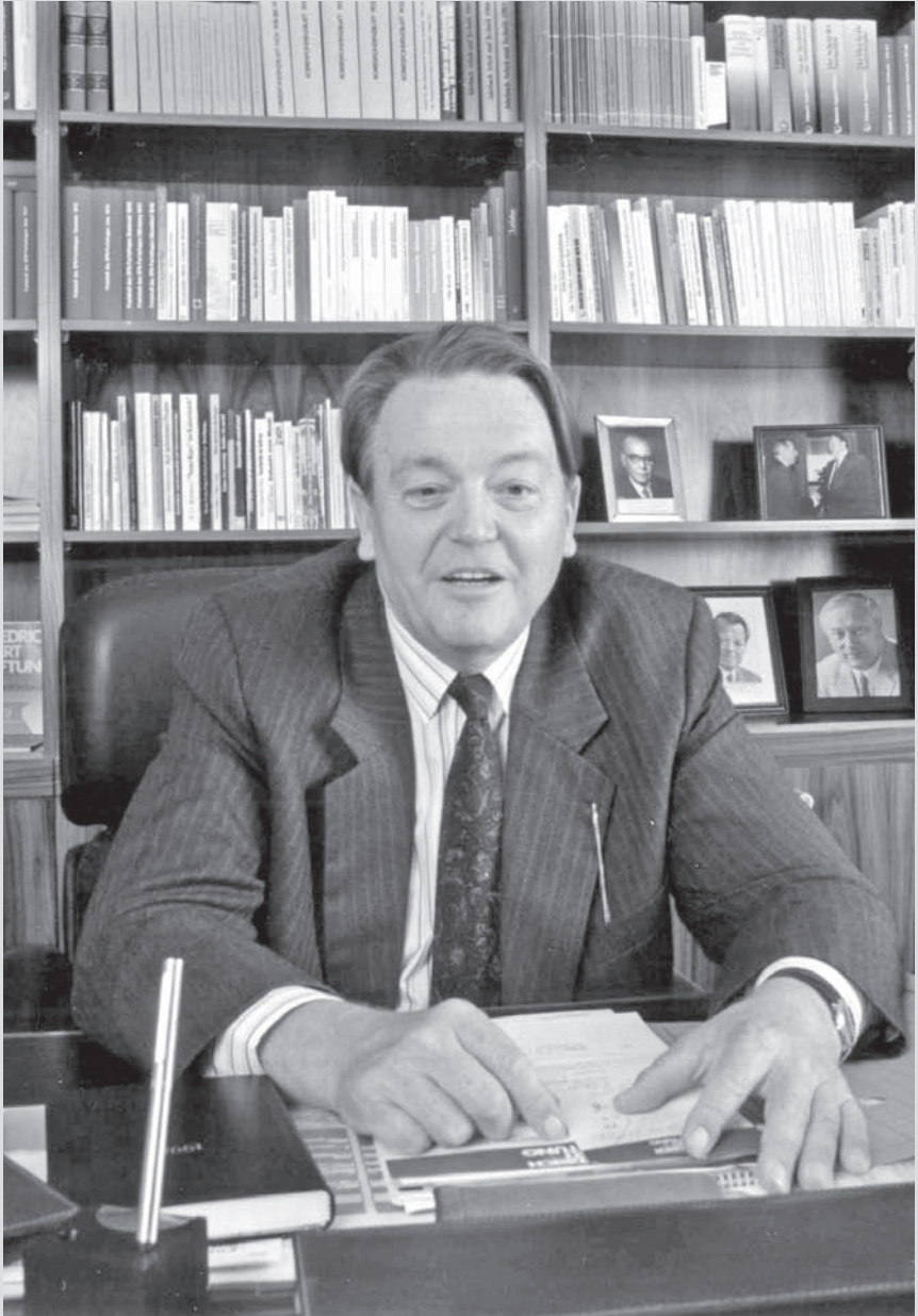
Holger Börner in seinem Büro in der Friedrich-Ebert-Stiftung, 4.12.1987