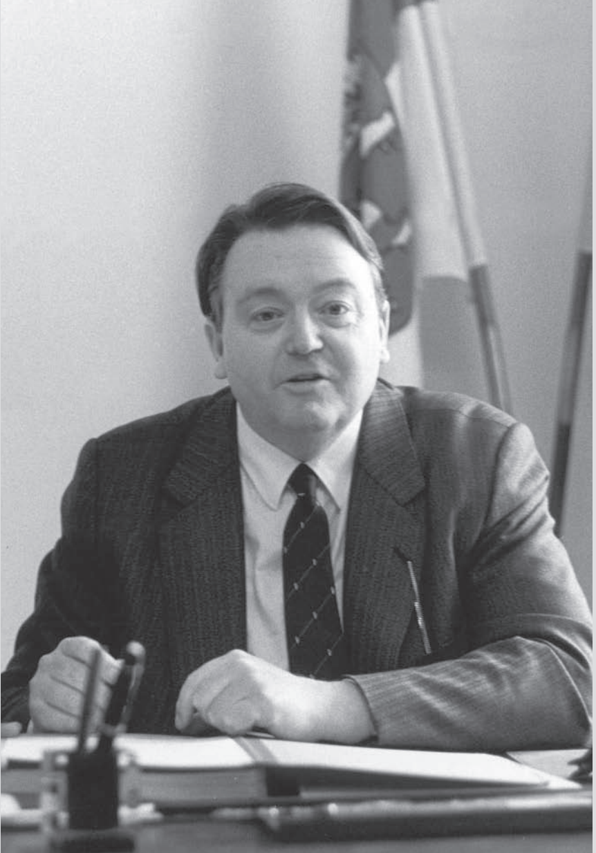
Holger Börner, Ministerpräsident des Landes Hessen 1976–1987