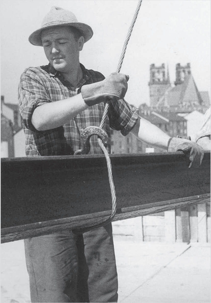
Holger Börner beim Bau des Kasseler Polizeiverwaltungsgebäudes, 15.8.1957